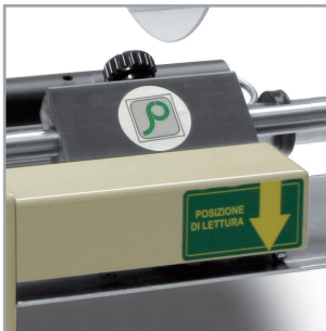
DE 16 Cream - FOTOCELLULA