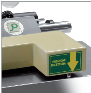
DE 16 Cream - MICRO

Impiego semplice ed universale per l'applicazione manuale di etichette larghe fino a 160 mm con spellicolatura automatica.