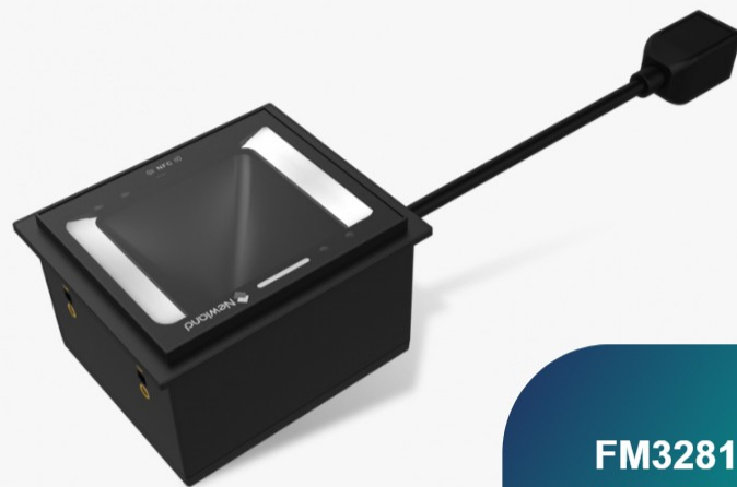
FM3281 Grouper Lettori fissi