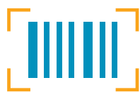
codici a barre